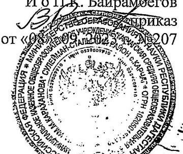
ГРАФИК проведения школьного этапа всероссийской олимпиады школьников в Республике Дагестан в 2023-2024 учебном году